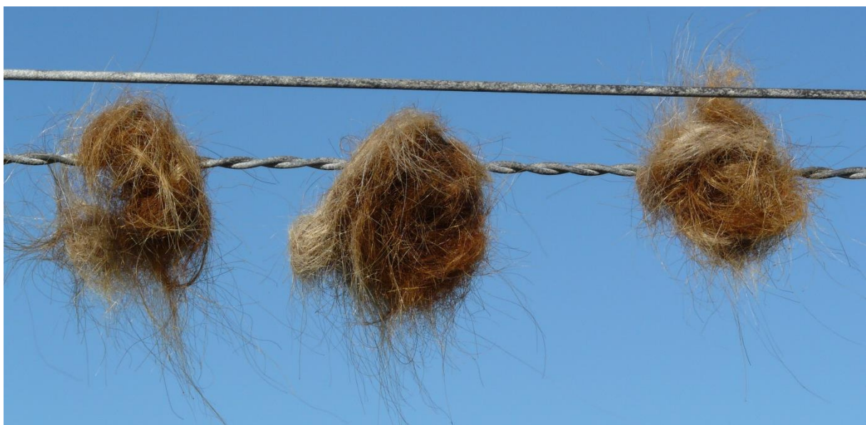
Wollige Locken der Schafe auf der schottischen Insel Skye (2012)